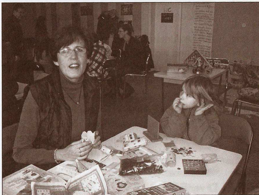
Kindertafel in der Hegelstraße